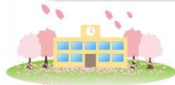
山梨県立 ふじざくら支援学校