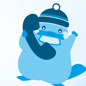
静岡ガス公式キャラクター ぼかぼかものはし