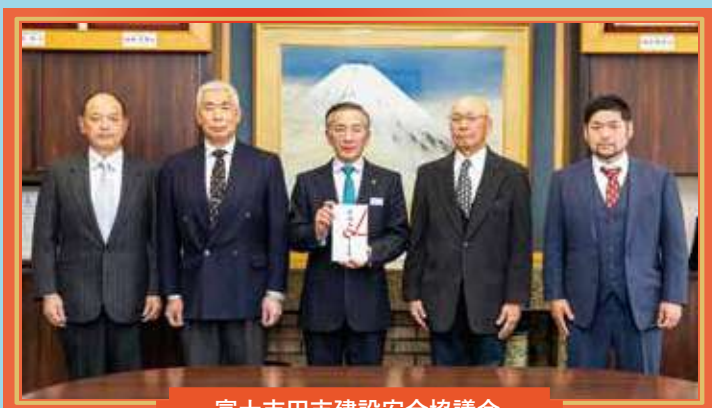
富士吉田市建設安全協議会