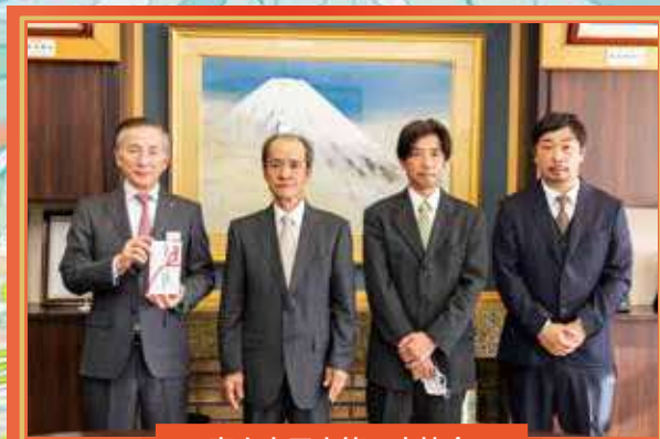
富士吉田市管工事協会