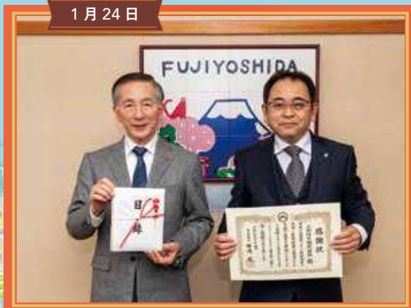
企業版ふるさと納税贈呈式 三和防災