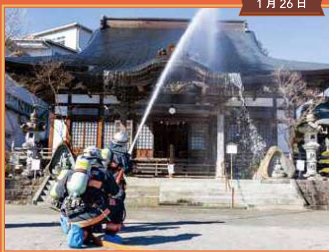
「文化財防火デー」防火訓練