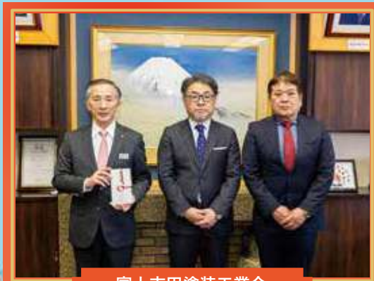
富士吉田塗装工業会