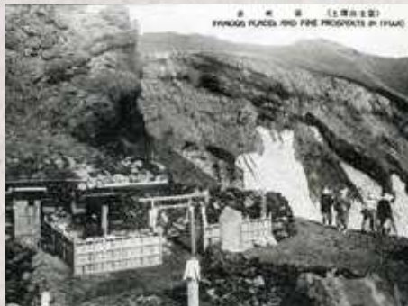
約100年前の御殿場口山頂の銀明水

二合目を越えると、凍った雪の上で強力が何度か滑って倒れたため「ガンジキ」と呼ぶ鉄を十字に組み合わせ、その各先端を曲げて尖らしたものを草鞋の下に装着して再び進み始めました。ガンジキは凍った雪によく食い込み、杖や鳶口を使わずに登ることができました。二合五勺に着くとたき火で体を温めながら朝食をとりました。休憩を終えて登り始めると急に日が差し込み「山側ノ雪ニ投射シ、山体ハ浮ヒ上リシカ如ク見工、恰モ淡紫紅ノ薄被ヲ白衣上ニ装ヒタルカ如クニシテ奥床シク見エタリ」と冬山でしか見ることのできない美しい景色を目の当たりにします。ただ、あまりにまぶしく目を傷める危険があるため、用意していた「淡青色ノ眼鏡」を着用しました。