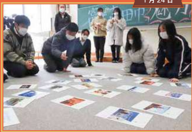
ひばりが丘高校 「ふじよしだカルタ」授業の実施