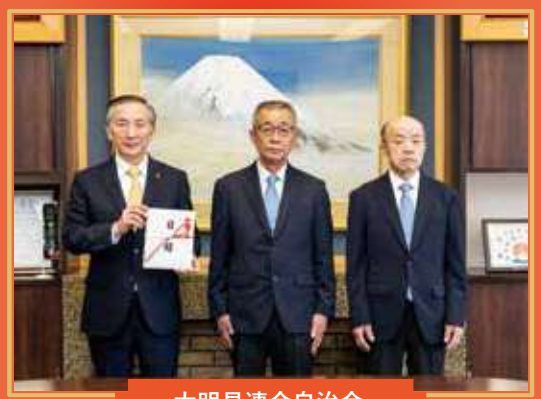
大明見連合自治会