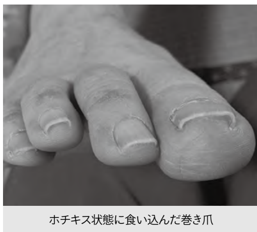
ホチキス状態に食い込んだ巻き爪

が変わってしまったたりということがあります。普段あまり意識されない足だからこそ、足の変化を早く見つけるために、じっくりと自分の足を見てみてください。