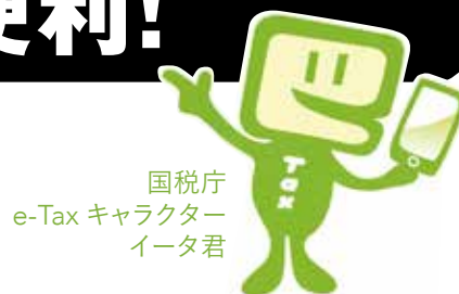
国税庁 e-Tax キャラクター イータ君