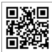
国税庁ホームページ