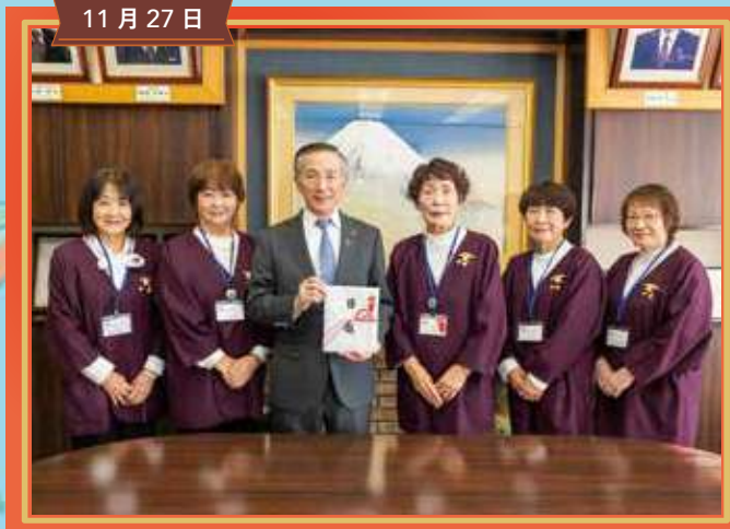
寄付金贈呈式 連合婦人会