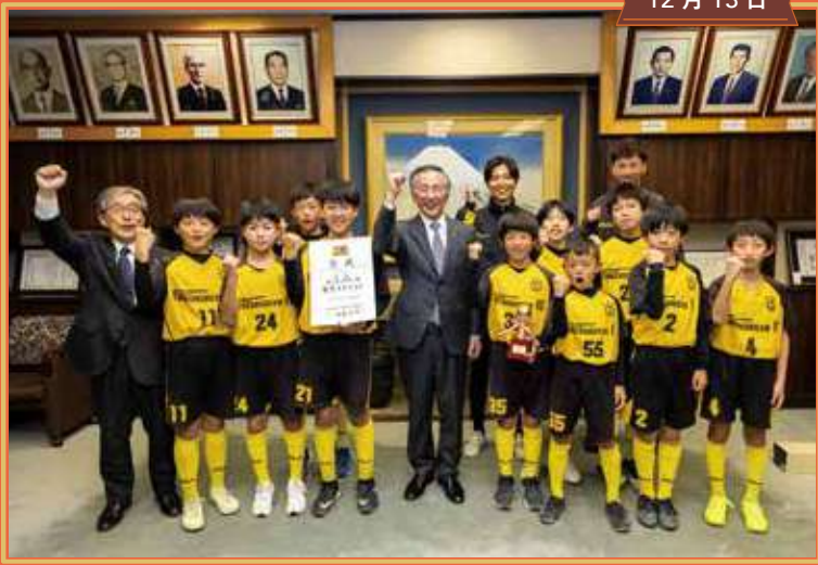
Fantasista FC 全日本U-12サッカー選手権 山梨県大会優勝報告