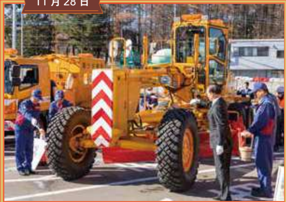
甲府河川国道事務所 除雪出動式