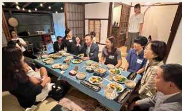
(2023年9月のごはん会には堀内市長にもお越しいただきました。)