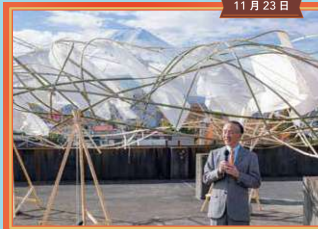
FUJI TEXTILE WEEK 2023 開幕式