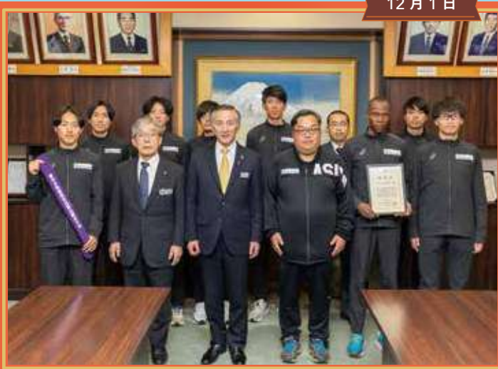
富士山の銘水 長距離陸上競技部 ニューイヤー駅伝出場報告