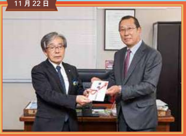
富士吉田市商業連合会 寄贈 定規セット