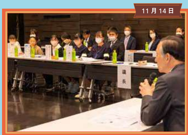
市長さんと話す会