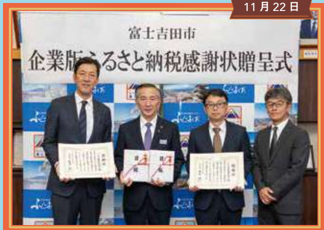
企業版ふるさと納税感謝状贈呈式 FSX株式会社・FSX富士株式会社