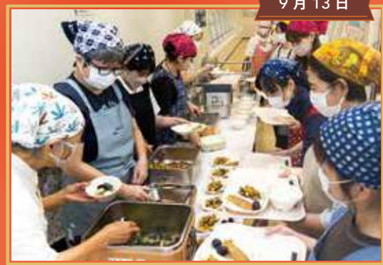
学校給食センター見学&試食会