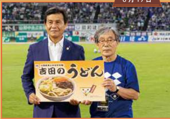
ヴァンフォーレ甲府サクスデー