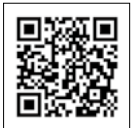
説明会などの詳細はこちら