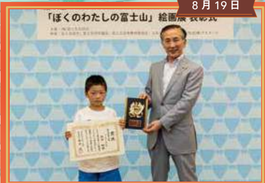
富士山こども絵画展表彰式