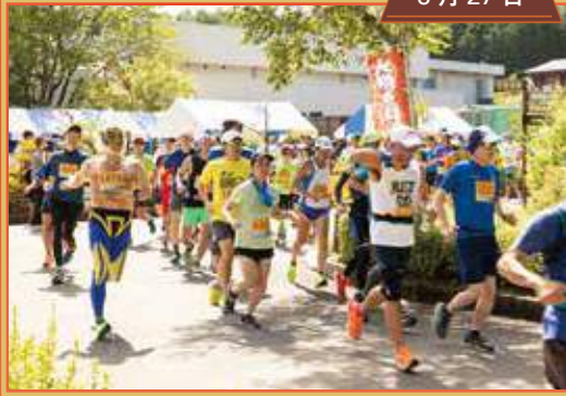
富士吉田火祭りロードレース