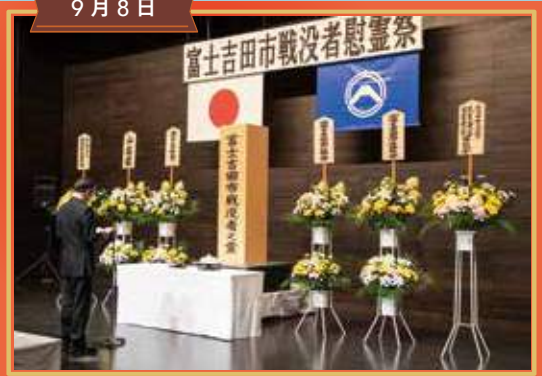
富士吉田戦没者慰霊祭