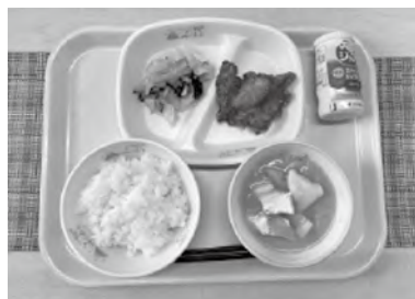
この写真は例です