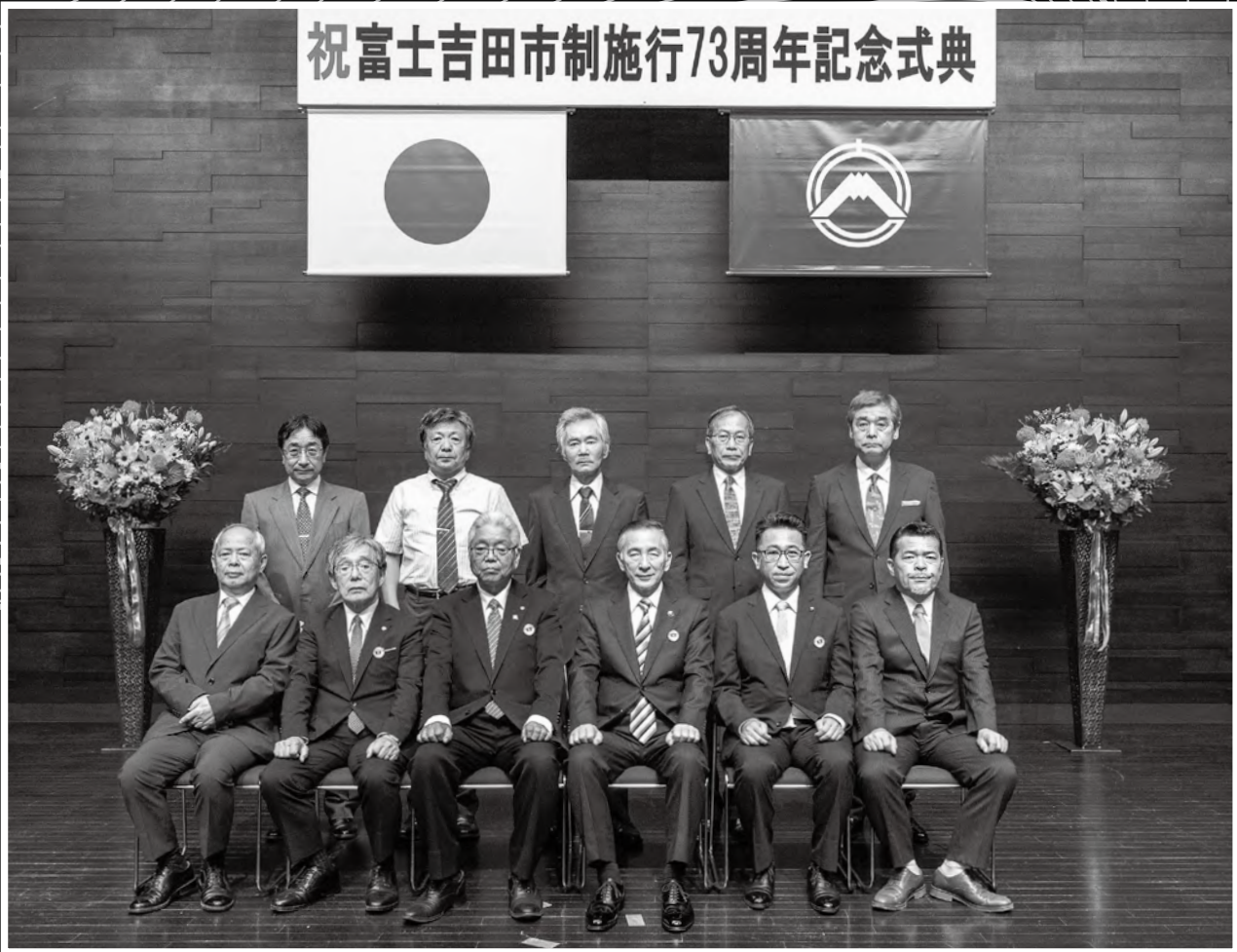
※富士吉田市制施行73周年記念式典の表彰者の写真です