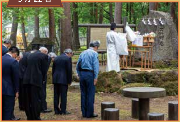
富士山安全祈願祭および 遭難者慰霊祭