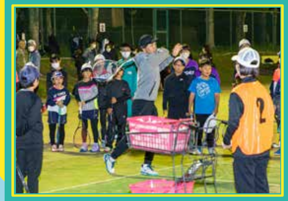
ファイナルイベント ソフトテニスのKing&Princess