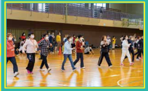
パワーウォーキング講座