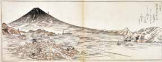
大明見から望む富士山『真写富士百図』(1898年)