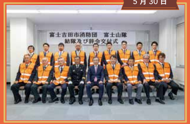
富士山隊 結隊および辞令交付式