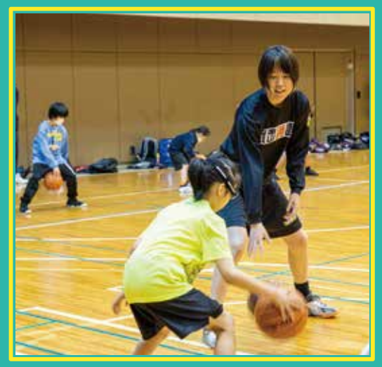
ファイナルイベント 山梨クィーンビーズに挑戦