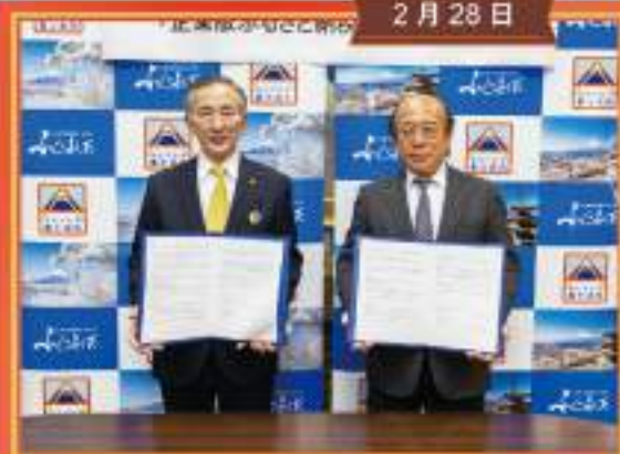
クスリのサンロードとの包括連携協定締結式および企業版ふるさと納税寄付金寄贈式