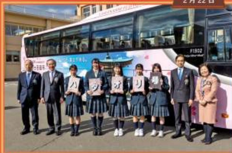
織物装飾高速バス“ハタオリ号”お披露目会