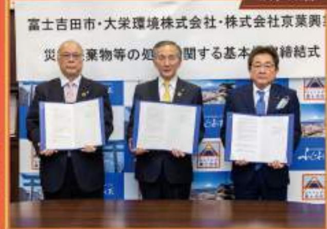
大栄環境・京葉興業との災害廃棄物等の処理に関する基本協定締結式