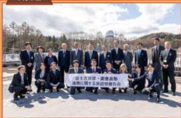
慶應義塾連携に関する対話型報告会