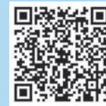
地方税お支払サイト

地方税お支払サイトでの支払方法はクレジットカードや口座振替、インターネットバンキングなどがあります。