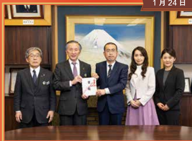
銘楽堂による音楽用品寄贈式