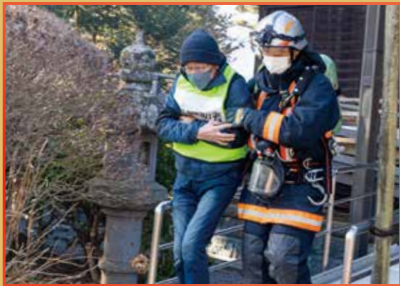
文化財防火デー「防火訓練」