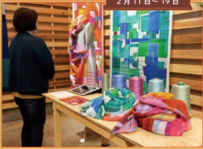
フジヤマテキスタイルプロジェクト2022 イマココ展