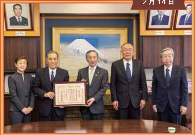
富士吉田市明るい選挙推進協議会 総務大臣表彰報告