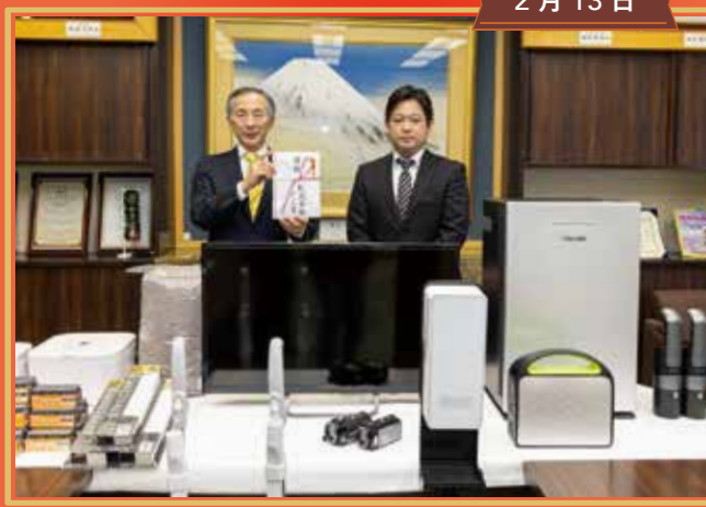
ノジマによるデジタル製品寄贈式