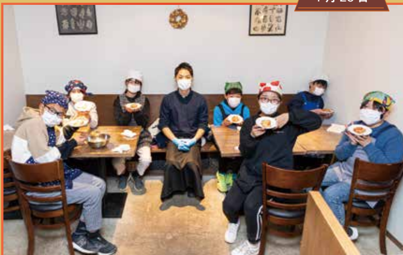
下一小6年生SDGs授業 西裏地区の飲食店のフードロスの取り組みを知ろう!