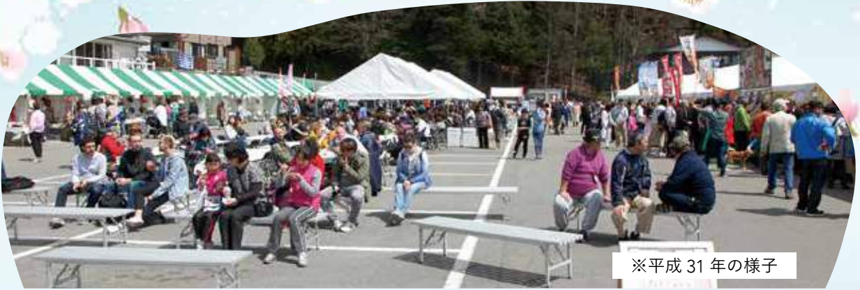
※平成 31 年の様子