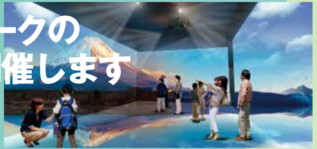
ふじさんミュージアム ふじさんVRシアター 詳細は次のページをご参照ください