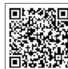
市のホームページ