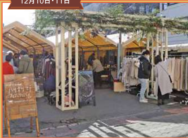
ハタオリマチのクリスマス