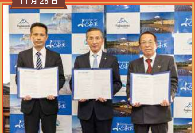
地域振興に関する富士山の銘水(株)および富士ウェーブ(株)との包括連携協定締結式