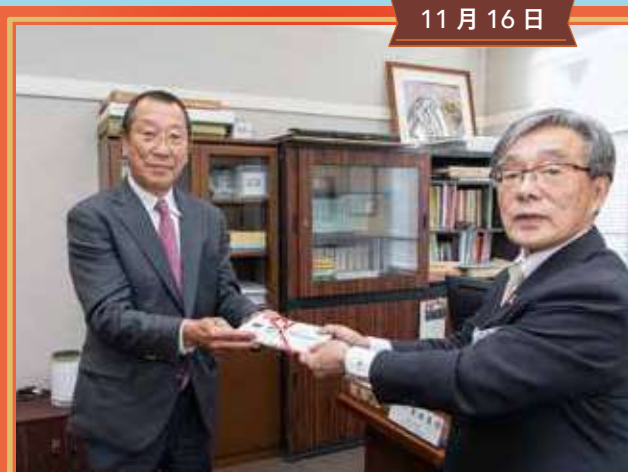
商業連合会から定規セットの寄贈