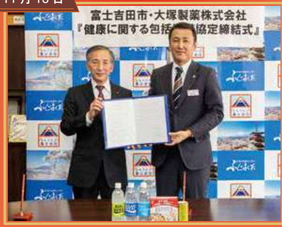
健康増進に関する大塚製薬(株) との包括連携協定締結式