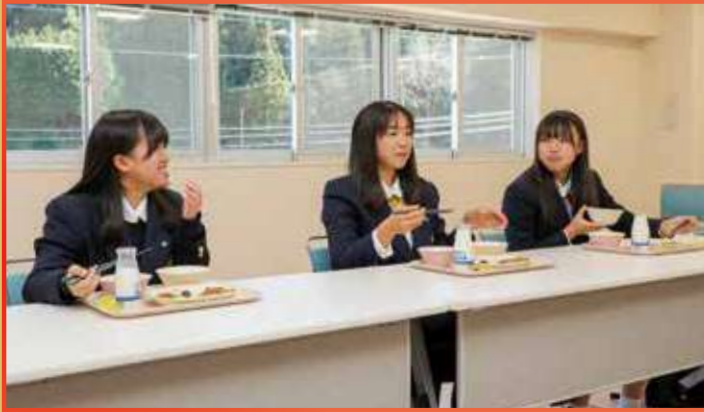
高校生の考案した給食献立の試食会