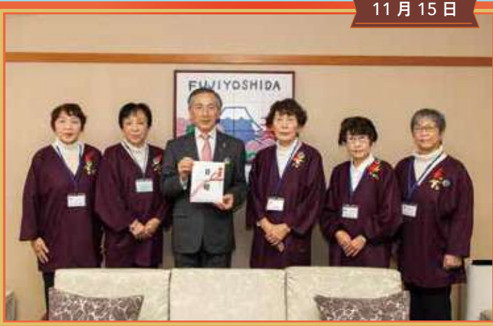
連合婦人会 1円玉貯金寄付金受納式