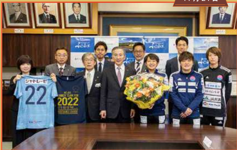
FCふじざくら山梨 なでしこリーグ2部昇格に伴う表敬訪問