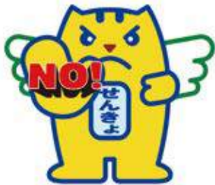
贈らない・求めない・受け取らない

年末年始は、何かと贈り物やお祝い事をする機会の多い時期ですが、政治家が選挙区内の人に、お金や物を贈ることは公職選挙法で禁止されています。有権者が政治家に寄付や贈り物を求めることも禁止されています。皆さん一人一人が寄付禁止のルールを守って、明るい選挙を実現しましょう。